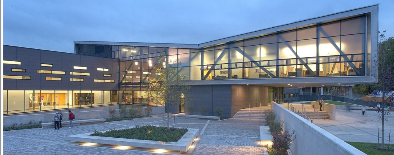
士嘉堡校区学生中心